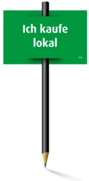
Katharina Tempel Umweltbeauftragte office360

Ich freue mich auf den Dialog mit Ihnen!